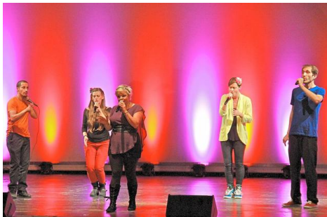
Die französische Formation „OMMM“ (gr. Bild) verzückte das Publikum in der Aasee-Aula mit tollen Lied-Arrangements. Rechts der Chor BonnVoice in der Schloss-Aula.

Münster - Das „Vocal Festival“ hat sich in seiner dritten Auflage vom Geheimtipp zum Publikumsmagneten entwickelt. Wieder einmal ist es dem Organisierteam gelungen, zahlreiche teilnehmende Pop- und A-Cappella-Chöre in die Musikhochschule, die Aasee-Aula und in das Schloss zu locken. Das ganze Wochenende über fanden Events, Konzerte, Workshops statt.